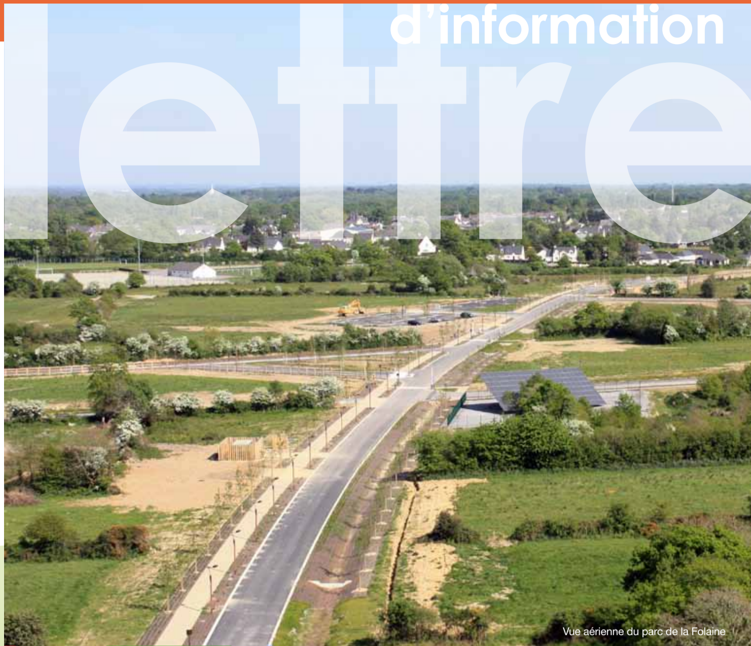
Vue aérienne du parc de la Folaine

Président de la communauté de communes Cœur d'Estuaire